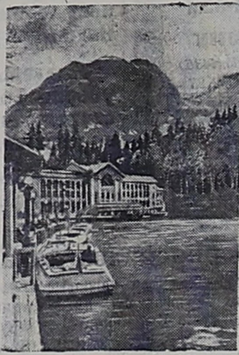
Абхазская АССР. Озеро Рица, вблизи курортного города Гагры.